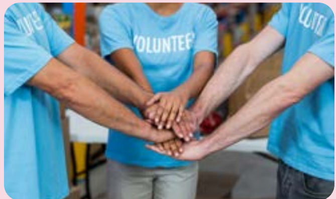
Llun: Grŵp o wirfoddolwyr yn dal dwylo

Dyma ymdrech i egluro rhai termau sy'n berthnasol i wirfoddoli. Maen nhw wedi'u rhestru yn ôl trefn yr wyddor.